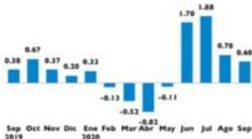
Inflación Mensual (%) Septiembre 2019 - Septiembre 2020

Santo Domingo, República Dominicana. - El Banco Central de la República Dominicana (BCRD) informa que el Índice de Precios al Consumidor (IPC) registró una variación de 0.60 % en el mes de septiembre con respecto a agosto de 2020, elevando la inflación acumulada de los primeros nueve meses del año (enero-septiembre) en 3.76 %. Con este resultado la inflación mensual muestra desde septiembre de 2019 hasta septiembre 2020 un nivel 0.02 %.