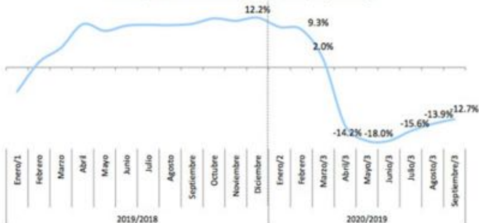
Gráfica 15 Evolución crecimiento acumulado de la recaudación Periodo/ año actual vs. Periodo/año anterior; en porcentaje

1/ Incluye ingresos extraordinarios por RD$10,536 millones en enero 2018, que no se repiten en enero 2019. Sin estos ingresos extraordinarios, el crecimiento de enero 2019 sería de 16.7%.